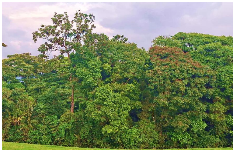
Bosque con presencia de Magnolia hernandezii y Magnolia gilbertoi

La vegetación de esta región se caracteriza por su enorme diversidad de arbustos, arbolitos y árboles de hasta 30 metros de altura, cuyos troncos y ramas se encuentran cubiertos de epífitas y bejucos, todos ellos emergiendo en medio de un paisaje montañoso, de neblina persistente y ríos cristalinos.